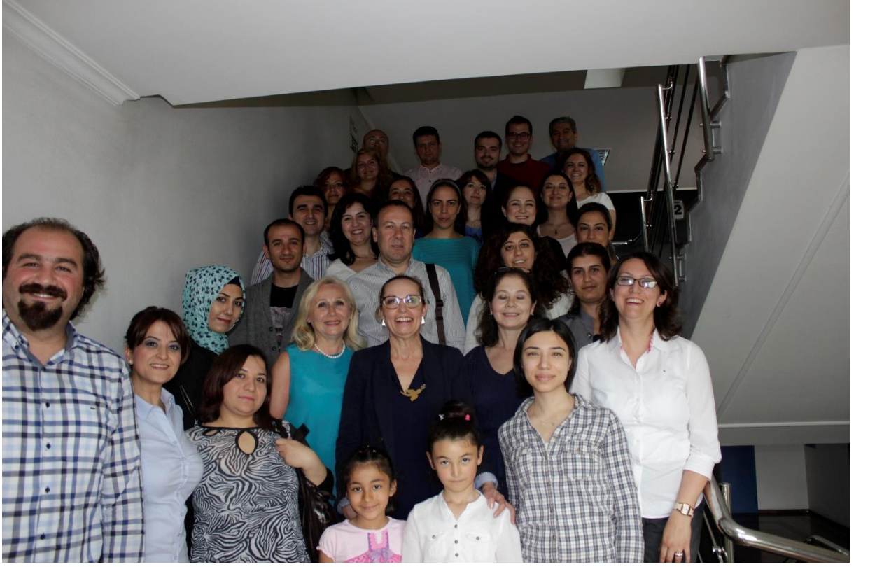
Dudak Damak Yarıkları Derneđi Üyeleri Ailelerle